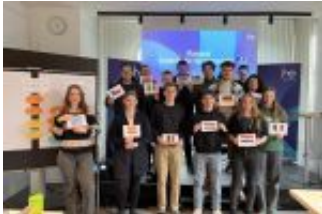
Spendenlauf 13. Jahrgang

Immer wieder wollen Menschen aus aller Welt aus den unterschiedlichsten Gründen nach Europa gelangen.